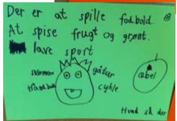
Billeder fra familieweekend. 11-13 maj 2012 Familierne svarede på spørgsmålet: Hvad er sundhed for jeres familie?